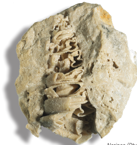
Nerinea (Ptygmatis) sp.

plexe Verengung bei heutigen Meeresschnecken unbekannt. Daher ist auch die Funktion dieses Merkmals umstritten bzw. nicht ganz klar, denn lebende Tiere können nicht studiert werden. Im Prinzip können Falten dazu dienen den Weichkörper kontrolliert in die Schale zurück zu ziehen, so dass die Mündung der Schale passend mit dem Deckel (Operkulum) verschlossen werden kann. Insbesondere die Furchen, die die Columellarfalte begleiten, haben wahrscheinlich dem Muskel für den Rückzug als Schienen gedient. Die anderen Falten ermöglichten es vermutlich, den Wasserdurchstrom durch die Mantelhöhle zu kanalisieren. Dieser diente der Versorgung des Tieres mit sauerstoffhaltigem Wasser und vermutlich auch mit Nahrung. Anders als die meisten anderen Meeresschnecken, strudelten die Nerineen wahrscheinlich nahrungshaltiges (z.B. Algen) Meerwasser ein und filterten die Nahrungspartikel heraus. Sie lebten möglicherweise teilweise eingegraben im Meeresboden. Nerineen konnten mit Schalenlängen von bis zu einem Meter beträchtliche Größen erreichen. Dies, ihre ungewöhnliche Morphologie und das Erlöschen am Ende der Kreidezeit machen die Nerineen quasi zu den Dinosauriern unter den Schnecken.