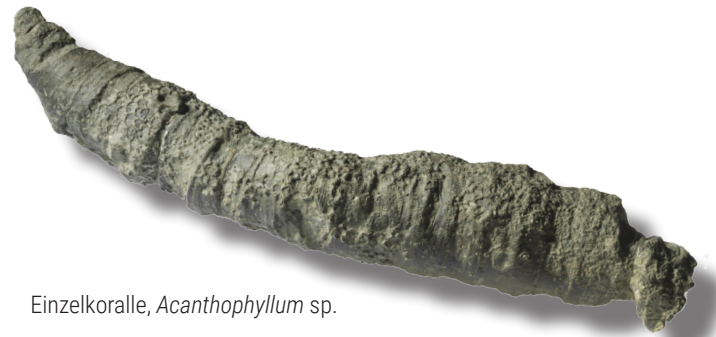
Einzelkoralle, Acanthophyllum sp.

Schemazeichnung einer rugosen Einzelkoralle mit den wichtigsten strukturellen Merkmalen.